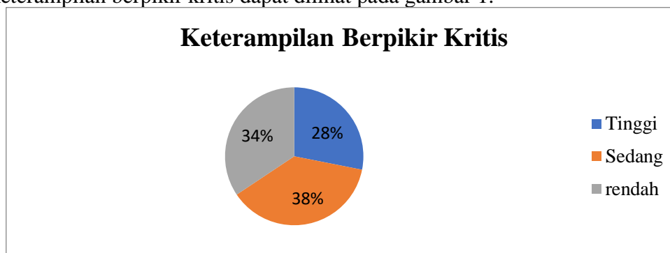
Gambar 1. Diagram Persentase Kategori Keterampilan Berpikir Kritis

Berdasarkan tabel 5 dapat diketahui bahwa persentase kategori tinggi sebesar 28,13% dengan jumlah siswa sebanyak 9, kategori sedang sebesar 37,50% dengan jumlah siswa sebanyak 12 dan kategori rendah sebesar 34,38% dengan jumlah siswa sebanyak 11. Persentase jumlah siswa perkategori keterampilan berpikir kritis dapat dilihat pada gambar 1.